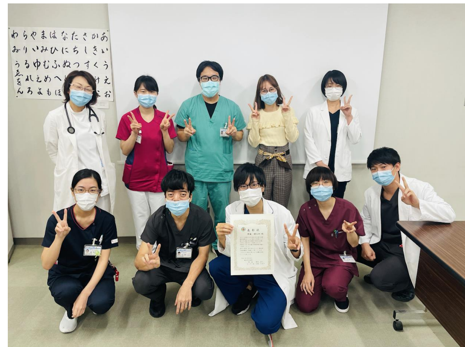
仲間たちと記念撮影